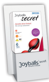
Joyballs secret Flyer-Halter / flyer holder for DIN long

Weitere Sprachen auf Anfrage. Additional languages on request.