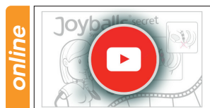
Joyballs secret Produktvideo / product video